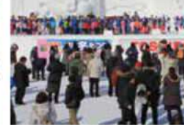
旭川冬まつり 2018年2月 ※