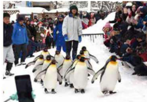
旭山動物園 ペンギンの散歩

※本誌に掲載している情報は、一部インターネットなどに掲載されている文献をもとに編集しておりますので、地域・風習等により異なる場合がございます。