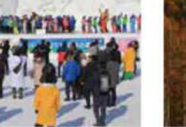
カラマツの紅葉と山並み 10月 ※