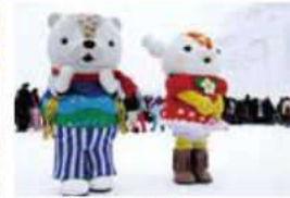
あさっぴーとゆっきりん ※