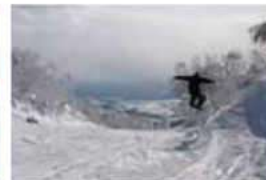
カムイスキーリンクス ※