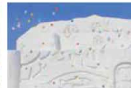
旭川冬まつり 2018年2月 ※