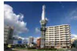
常盤ロータリー 7月 ※