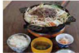
よねちゃん食堂のジンギスカン