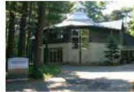
三浦綾子記念文学館 ※