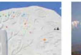
カラマツの紅葉と山並み 10月 ※